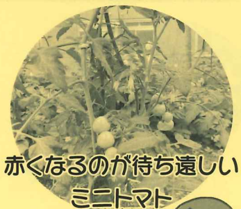
赤くなるのが待ち遠しいミニトマト

5月に小学生と一緒に植えた野菜たち。7月に無事収穫の日を迎えました!初めは少し成長が遅いかな?という印象でしたが、夏本番の暑さとともに急成長。収穫した初キュウリは利用者様といただきました。ピーマン、トマトももうすぐです。しばらく野菜たちから目が離せなくなりそうです。