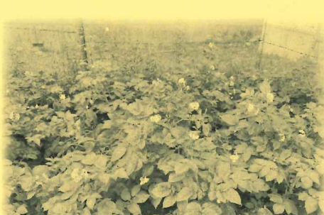
じゃがいもも順調に育っています