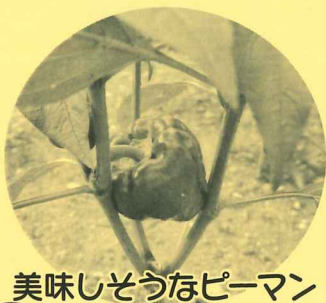
美味しそうなピーマン