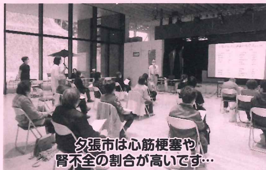
夕張市は心筋梗塞や腎不全の割合が高いです...

続いて前沢所長から、夕張市における主な死因についての傾向と原因などのお話とともに、「いのちの基調について」という今年度のテーマを掲げた理由や、からだの基調・こころの基調について、また今後の講話内容についてのお話がありました。