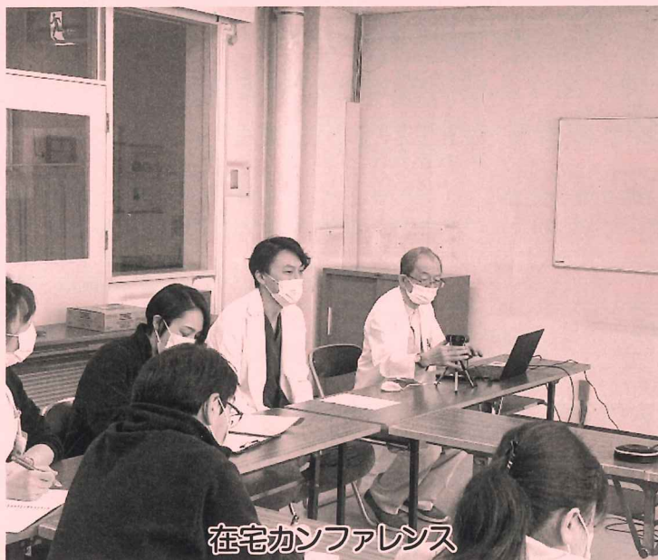
在宅カンファレンス