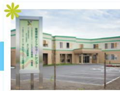
CoCO(ココ)東雁来式番館