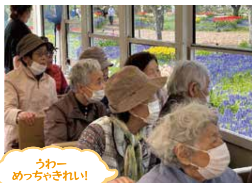
うわー めっちゃきれい!