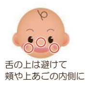
舌の上は避けて頬や上あごの内側に