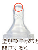
塗りつける穴を開けておく