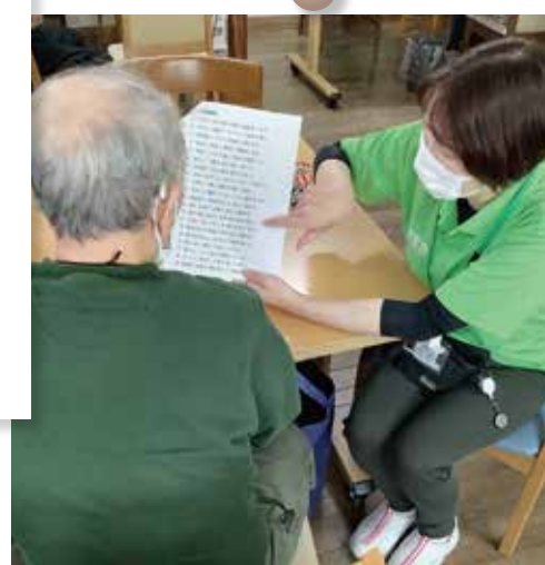
飲み込みをサポートする 口腔機能訓練