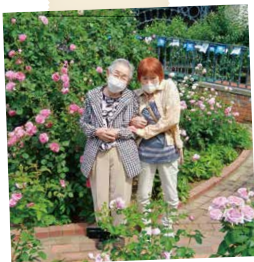
お楽しみ！外出行事