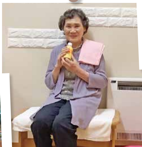
リラックスできる 個別入浴