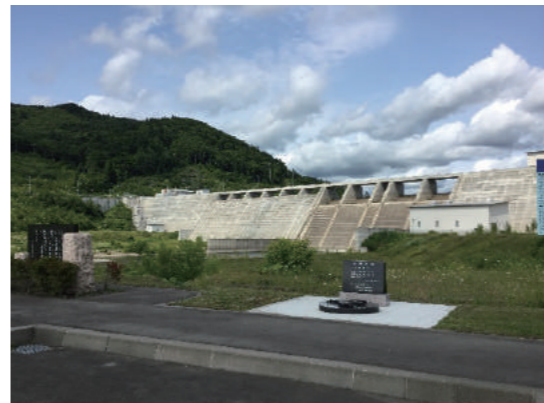
自然に囲まれて癒やされました

7月に外出行事に行っています。例年、この時期は海に行って『海行事』を実施していますが、今年は当別町へ行き『太海駅』『スウェーデンヒルズ』『当別ダム』『道の駅』と観光夏行事を開催いたしました。当別は札幌に隣接している町で道のりも、あまり遠くなく車内は期待に胸が踊る会話で一杯でした。