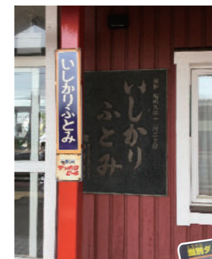
駅に行った 記念に一枚！