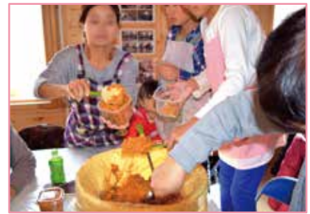
▲11月19日開催 お味噌作りの会の様子 (2月13日に仕込んだお味噌がおいしくできました)

「医療・福祉・生活」と「農業」を結び付ける場として農作物の栽培と加工・販売を行う拠点として道産材で造られた「ニルスのお家」では、多目的に利用できる研修室と、お菓子作りを行っている加工センターがあります。